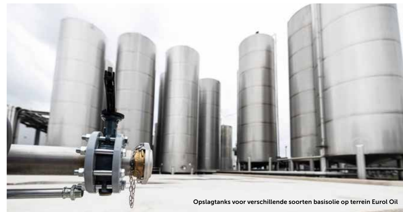
Opslagtanks voor verschillende soorten basisolie op terrein Eurol Oil