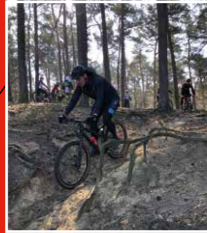
27 maart MTB clinic

En dat presteren op de toppen van je kunnen vraagt om een gezonde geest in een gezond lichaam. Wij noemen dat lekker CLAFIT zijn. Energie hebben om elke uitdaging aan te gaan! CLAFIT is ons vitaliteitsprogramma. Het draait onder andere op de sportieve initiatieven van onze collega's. Zij krijgen alle mogelijkheden om de gaafste sportevenementen te organiseren. De regie ligt dan ook daar waar het hoort: bij onze Clafist!