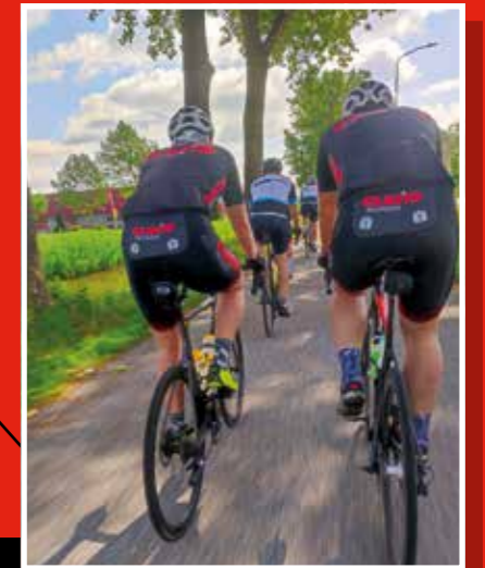
25 mei Energietocht