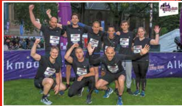
25 mei Alkmaar city run